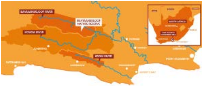
FIGUUR 3: KAART ZUID AFRIKA.

tief eigenaar zijn, de Baviaanskloof Development Company. Deze Development Company voorziet dus in een alternatieve inkomstenbron zodat de boeren kunnen omschakelen van geiten naar het verbouwen van lavendel, rozemarijn en andere aromatische oliën. De geiten kunnen zo van de gedegradeerde hellingen afgehaald worden en deze hellingen komen vervolgens beschikbaar voor herstelmaatregelen. Door het herstel van puinwaaiers (waaievormige hopen gesteente die wateropname in de grond bevorderen) en de herbebossing met inheemse bomen en struiken, zoals Spekboom , kan het gedegradeerde landschap hersteld worden, verbetert de (grond-)waterhuishouding aanzienlijk en kunnen lokale inwoners hun inkomsten niet alleen veiligstellen op de lange termijn, maar ook verbeteren op de korte termijn.