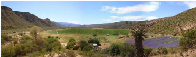
FIGUUR 4 A EN B: INTERVENTIE IN DE BAVIAANSKLOOF: DOOR DE GEITEN VAN DE HELLINGEN AF TE HALEN EN EEN ALTERNATIEVE INKOMSTENBRON TE BIJDEN, WORDT LANDSCHAPHERSTEL MOGELIJK GEMAAKT. VOOR EN NA.