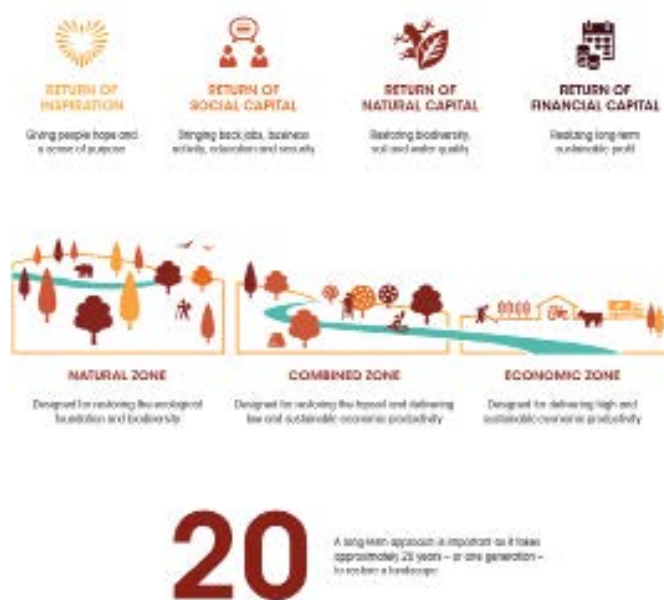
FIGUUR 2: SAMENVATTING 4 RETURNS, 3 ZONES, 20 YEARS.

Het opzetten van partnerships voor landschapsherstel met de flexibiliteit om steeds nieuwe oplossingen voor complexe stakeholdervraagstukken te ontwikkelen vereist een langetermijnhorizon. Ecologisch herstel kan decennia duren. Om duidelijkheid te verschaffen aan langetermijninvesteerders hebben we gekozen voor een horizon van 20 jaar – oftewel één generatie.