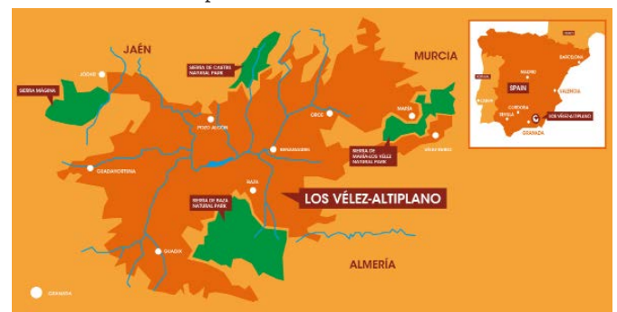
FIGUUR 6: KAART SPANJE.

In het zuiden van Spanje initieerde Commonland de vereniging AlVelAl, een lokale en snel groeiende vereniging van boeren en andere belanghebbenden die werkt aan het herstel van 630.000 hectare land in de regio. AlVelAl is genoemd naar de drie landstroken in de regio: Altiplano, Los Vélez en Alto Almanzora. In dit gebied hebben decennia van overbegrazing, monoculturen en onzorgvuldig waterbeheer geleid tot bodemdegradatie in de vorm van verzilting, erosie en verlies aan bodemvruchtbaarheid. Samen met vereniging AlVelAl ontwikkelde Commonland een groot-schalig 4 returns landschaps-herstelplan voor de regio, dat de komende jaren zal worden uitgevoerd. Een van de aspecten van het herstelplan is het zogenaamde 'almendrehesa concept': een geïntegreerd productiesysteem dat amandel- en lokale bomen combineert met oliegewassen (voor de productie van aromatische oliën), de bijenteelt, en duurzame begrazing door inheemse schapen soorten. Dit productieve ecosysteem vermindert erosie, herstelt de waterbalans, vergroot de biodiversiteit, en verfraait het landschap. Al met al versterkt het de lokale economie, én het bevordert de lokale trots en inspiratie. Daarnaast zijn meer dan 30 business cases geïdentificeerd die nog verder kunnen bijdragen aan het herstel van het landschap en wordt een aantal demo-boerderijen opgericht, tezamen met een onderzoekscentrum, om het economisch potentieel van het 'almendrehesa concept' te demonstren en de implementatie te stimuleren.