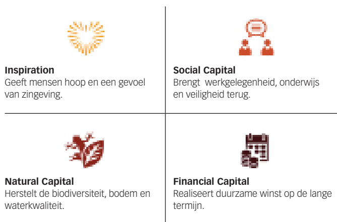
FIGUUR 1: DE 4 RETURNS® AANPAK VAN COMMONLAND.

We richten ons op het optimaliseren van 4 returns®, te weten die van Inspiratie, Sociaal, Natuurlijk, en Financieel kapitaal.