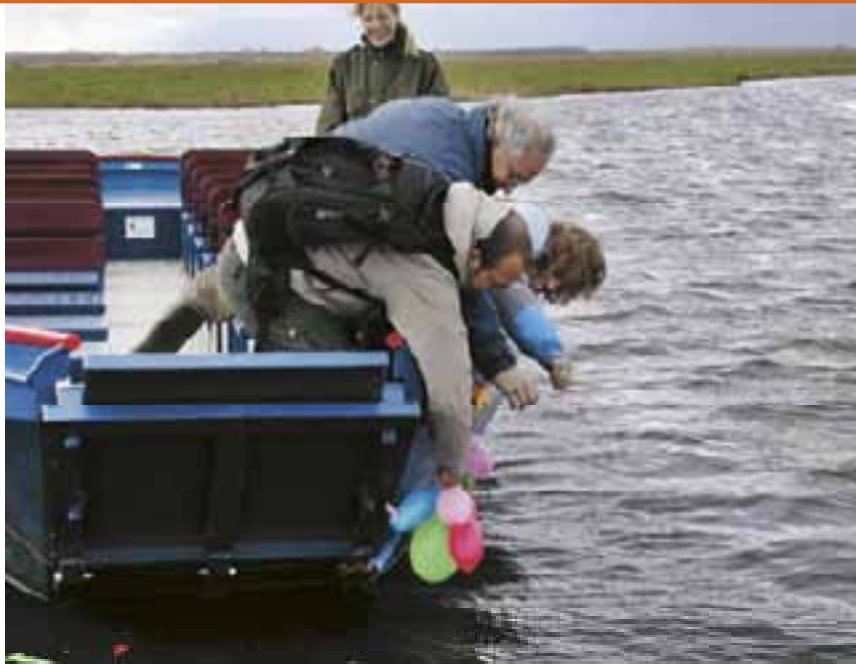
doop excursieboot 'Vera'. Landschap Noord-Holland kon deze fluisterboot kopen dankzij een gift uit naam van een mevrouw wier voornaam nu op de boeg prijkt.

zich met hun mvo-beleid regionaal. Dat komt omdat de provinciale landschappen vooral contacten hebben opgebouwd met regionaal georiënteerde bedrijven.