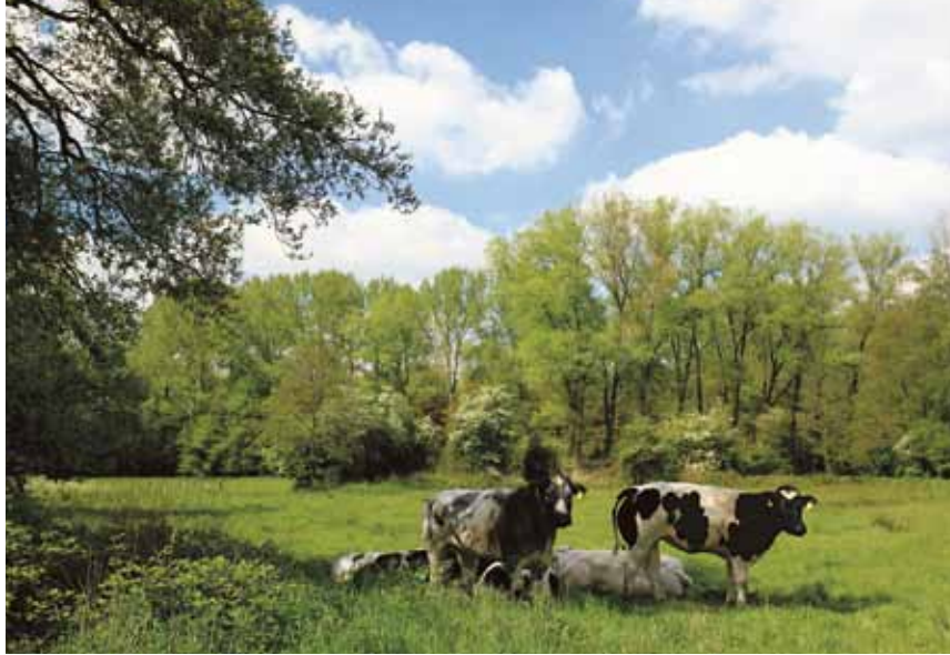
De Mortelen, Noord-Brabant