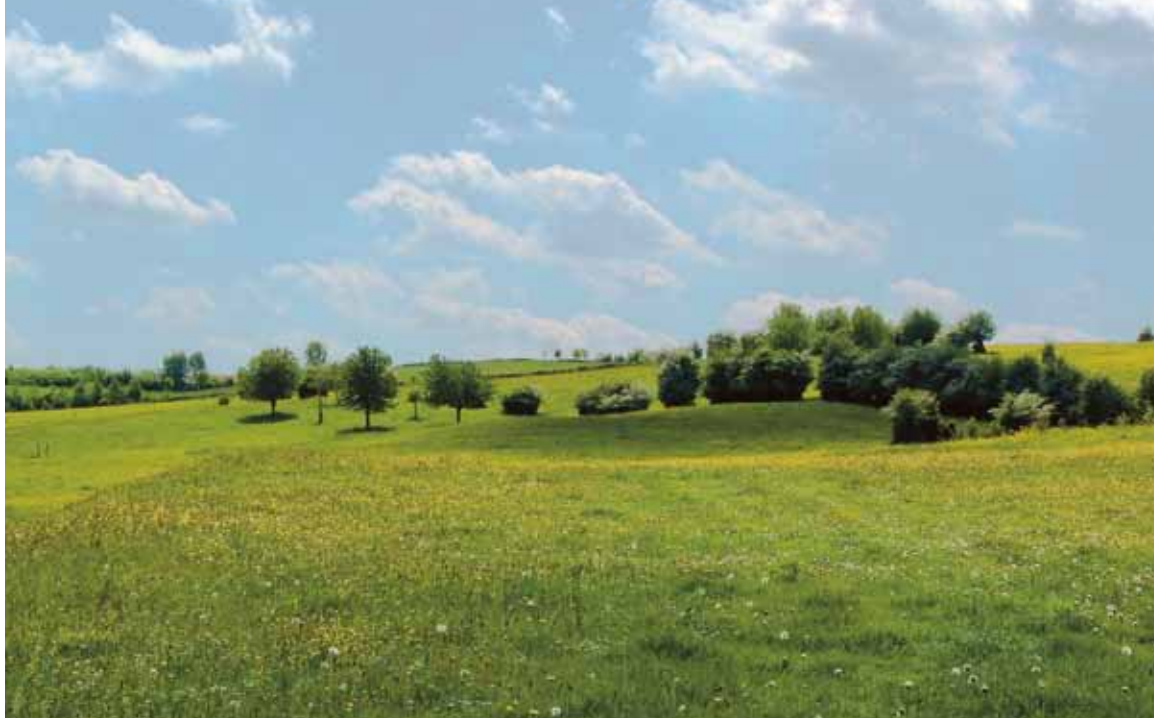
Gerendal in Zuid-Limburg