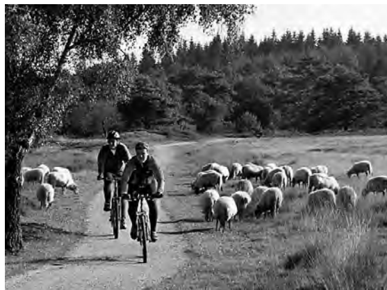
Havelterberg

Het is een lange weg van de Mansholt-doctrine via varkenspest en crisiswetten naar de huidige non-trade concerns en trend van verdergaande vermaatschappelijking en vooral ook verlandschappelijking. In wezen gaat het om een totale Umwertung van kwantiteitslandbouw naar kwaliteitslandbouw. De Duitsers zelf gebruiken in dit verband overigens een nog mooiere term en spreken van Umnutzung van de landbouw. We staan thans voor de transitie naar een meer marktgerichte en duurzame landbouwproductie die meer en meer gekoppeld wordt aan maatschappelijke waar-