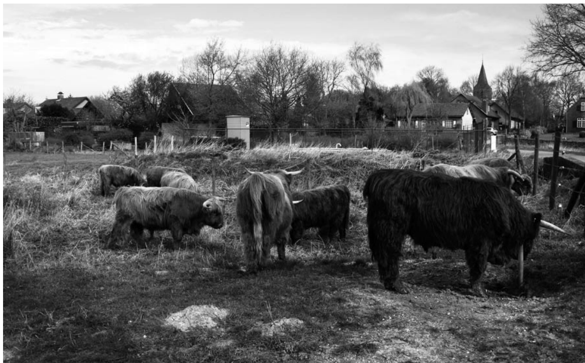
Schotse hooglanders bij Linden, aan de Maas bij Cuijk.

ophouden. Het aanleggen van buffergebieden werkt hierdoor niet.