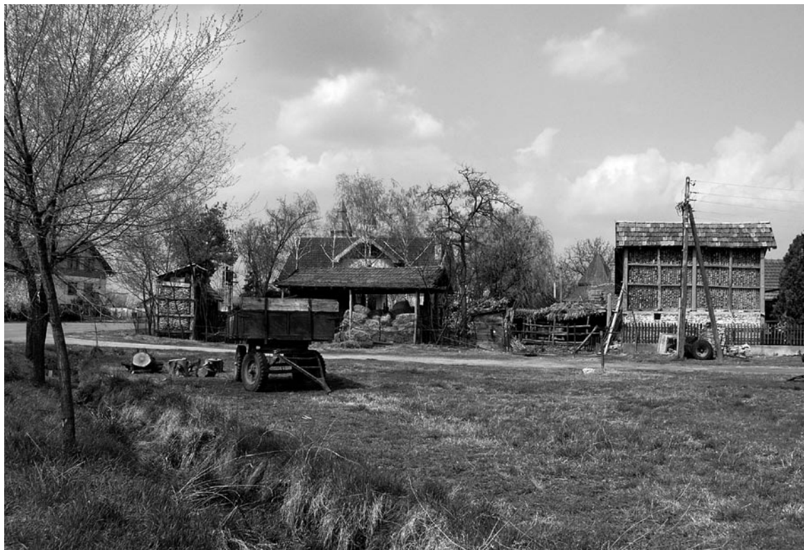
Platteland in Servie dat ons herinnert aan de jaren vijftig en zestig van de vorige eeuw.

landschap' in het algemeen is, maar zodra het concreet wordt komen de verschillen aan het licht. We hebben te maken met individuele belangen en beslissingen, binnen een historisch kader, waarbij de perceptie van het een landschap een intuïtie is. Een boer kan op vakantie genieten van het oude kleinschalige landschap in Twente terwijl hij op zijn eigen bedrijf de inrichting grootschalig wil hebben. Als economische belangen prevaleren worden de tegenstellingen en de verschillen in opvattingen duidelijker. Willen we een evenwichtige ontwikkeling met het behoud of de ontwikkeling van het kenmerkende landschap dan dienen de cultuurhistorische, ecologische en architectonische aspecten samen te gaan met de sociale belan-