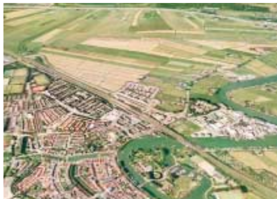
Links: Arcadia .