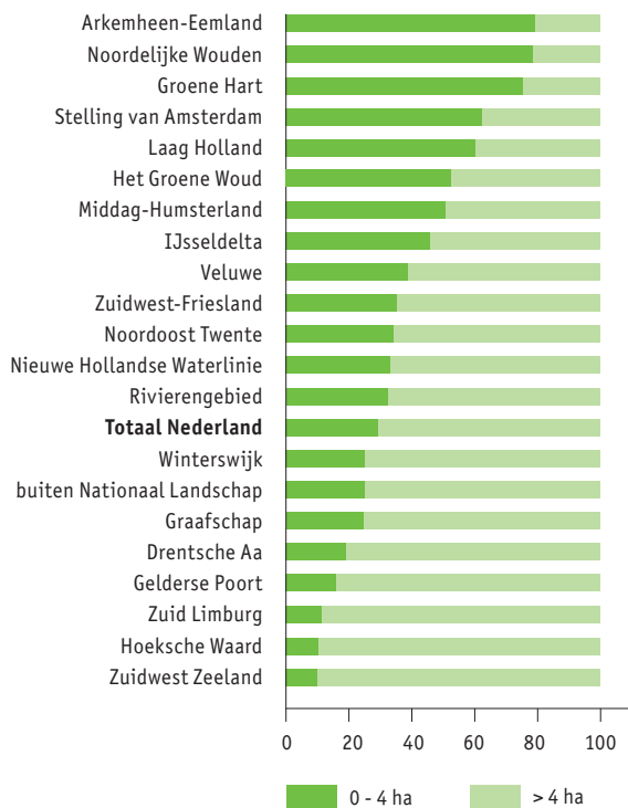
Figure 2 shares of parcels smaller and larger than 4 ha in the National Landscapes and for the Netherlands as a whole.

bouwareaal waar de omvang van de percelen wel een probleem is, bestaat – niet geheel onverwacht – voor een groot deel uit gebieden waar landschapsbeheer noodzakelijk is voor het behoud van het kleinschalige karakter. In verschillende Nationale Landschappen bijvoorbeeld bestaat meer dan de helft van het oppervlak uit percelen kleiner dan vier hectare (figuur 2); in de Noordelijke Friese Wouden en Arkemheen-Eemland is dat zelfs meer dan driekwart. Hier en vooral in de Noordelijke Friese Wouden, het Groene Hart en in Zuid Limburg worden dan ook relatief veel landschapselementen beheerd met subsidie (Wiertz et al., 2007). In andere gebieden met veel percelen kleiner dan vier hectare is de belangstelling voor landschapspakketten echter veel geringer. De