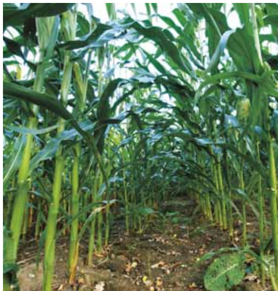
weinig aantrekkelijk habitat voor vlinders.