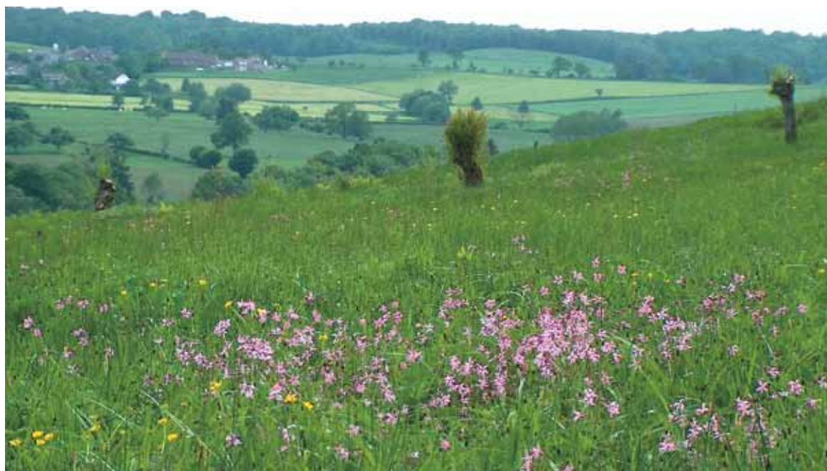
Vlindervriendelijk landschap in Zuid-Limburg bij Eijsseheide.

deren. Beide indicatoren laten ook grote verschillen zien tussen de lage, vlakke en voedselrijke delen van vooral Noordwest-Europa, en de heuvel- en berggebieden in de rest van het continent. In Noordwest-Europa gaat de toch al sterk verarmde fauna van het agrarisch gebied, ondanks kleinschalige pogingen het tij te keren (zie bijvoorbeeld Noordijk et al. , 2010), toch nog langzaam verder achteruit. De Europese Unie is zich van deze trends bewust. Zo is de eindconclusie van het rapport over de ontwikkeling van de biodiversiteit van Europese graslanden: “This is mainly caused by habitat loss and degradation due to intensified farming or abandonment of agricultural land” (European Environmental Agency, 2010).