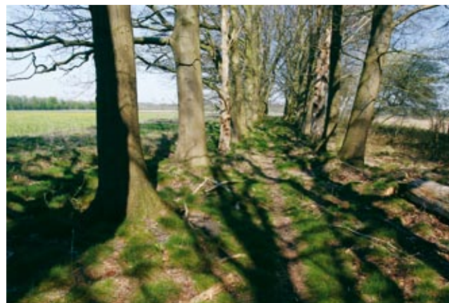
“De toegankelijkheid van het platteland van het landschap moet weer hersteld worden.”

tuurlandschap uit. Dat zit niet in de MKBA. Met andere woorden de MKBA geeft geen inzicht in de instandhoudingskosten van het landschap. En dat is een probleem waar politiek Den Haag met een boog om heen loopt. De planologische geest is uit de fles omdat we ons nooit aan restricties hielden en omdat er toch altijd weer voorbij die lijn gebouwd mocht worden. Hoe stoppen we die geest weer terug in de fles? Als het geen rode contouren mogen zijn, doet u dan maar groene. De dingen die we willen beschermen moeten we een duidelijker planologische bescherming geven. We zien dat dat een buitengewoon kalmerende werking heeft op de grondprijzen. Een voorbeeld is